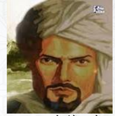
الرحالة المعروف ابن بطوطة