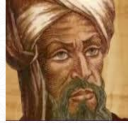
عالم الرياضيات واليه ينسب علم الخوارزميات الخوارزمي