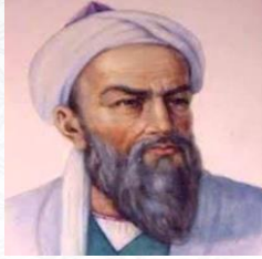
أشهر علماء الطب والكيمياء والرياضيات أبو بكر الرازي