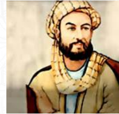
صاحب أضخم موسوعة طبية ابن النفيس