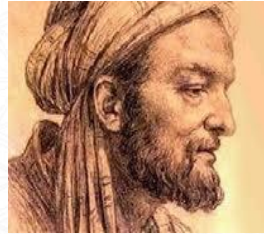
أشهر علماء الكيمياء والفلك والهندسة وعلم المعادن والفلسفة والطب والصيدلة أبو بكر الرازي