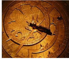
عالم الرياضيات والفلك ومخترع الاسطرلاب محمد الفزالي