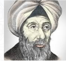
عالم الرياضيات والفيزياء وطب العيون ابن الهيثم