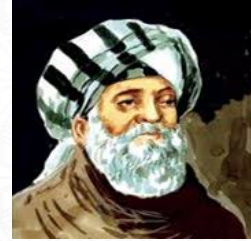
عالم الرياضيات والفلك وأول من توصل الى طول السنة الشمسية ثابت بن قرّة