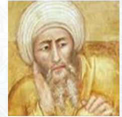
فيلسوف وطبيب وققيه وقاضي وفلكي وفيزيائي ابن رشد